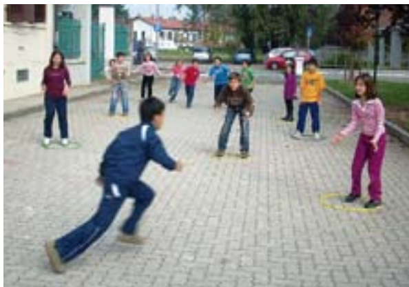
Due esempi di giochi attraverso cui i bambini imparano la Costituzione (foto Macagno)