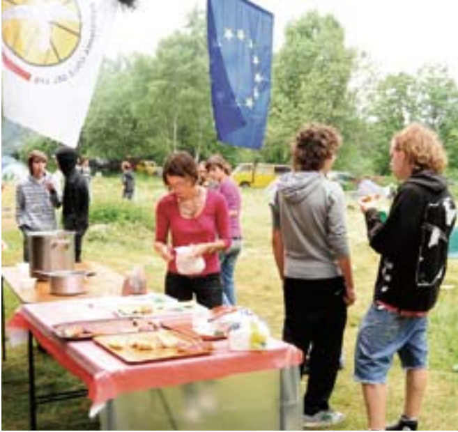
Due immagini dell'Eurolys di quest'anno: sotto, una parte del gruppo ripreso alla manifestazione del Colle del Lys e, a sinistra, un momento di relax al campo