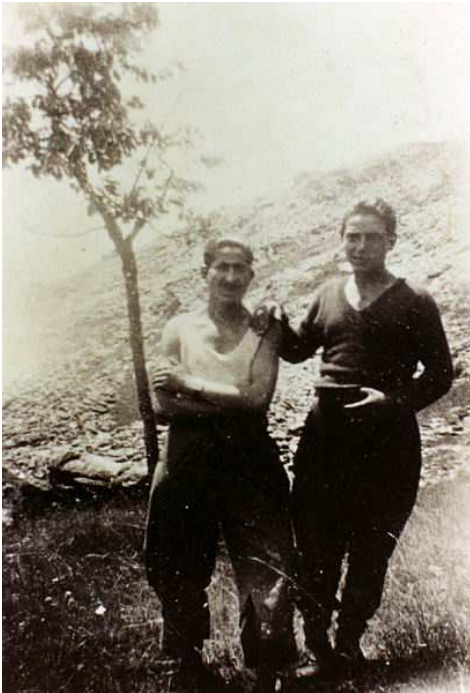
Partigiani al colle Portia

Riferimenti storici: l'intero percorso attraversa luoghi ampiamente utilizzati dai partigiani durante il periodo resistenziale. Il colle della Portia fu passaggio obbligatorio per andare da Val della Torre verso i colli Lunella e Grisoni e verso il vallone di Richiaglio e la valle di Viù. Il colle Lunella, per la sua posizione a cavallo del costone che separa la val Ceronda e il vallone di Richiaglio, rappresentò un'ideale punto di osservazione dei movimenti su entrambi i settori e proprio per questo alcune baite della zona furono utilizzate dai ragazzi del distaccamento "Mondiglio" come ricoveri, cucina, magazzino viveri e materiali vari; tra queste baite vide la luce "I Cavalieri della Macchia", uno dei giornali murali in cui i giovani "ribelli" si raccontavano e si confrontavano. Colle Grisoni, che con i suoi 1405 m. di quota offre un'eccezionale visione panoramica della zona, fu utilizzato durante la lotta di Liberazione come punto di osservazione e di guardia contro eventuali aggressioni provenienti dalla zona di Toglie o di Richiaglio.