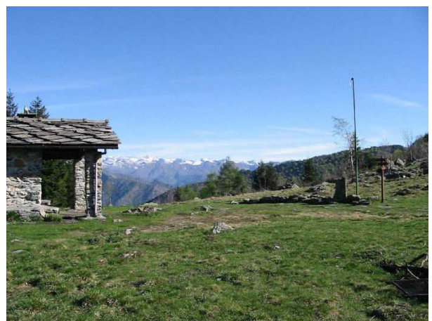
Rifugio al colle Portia